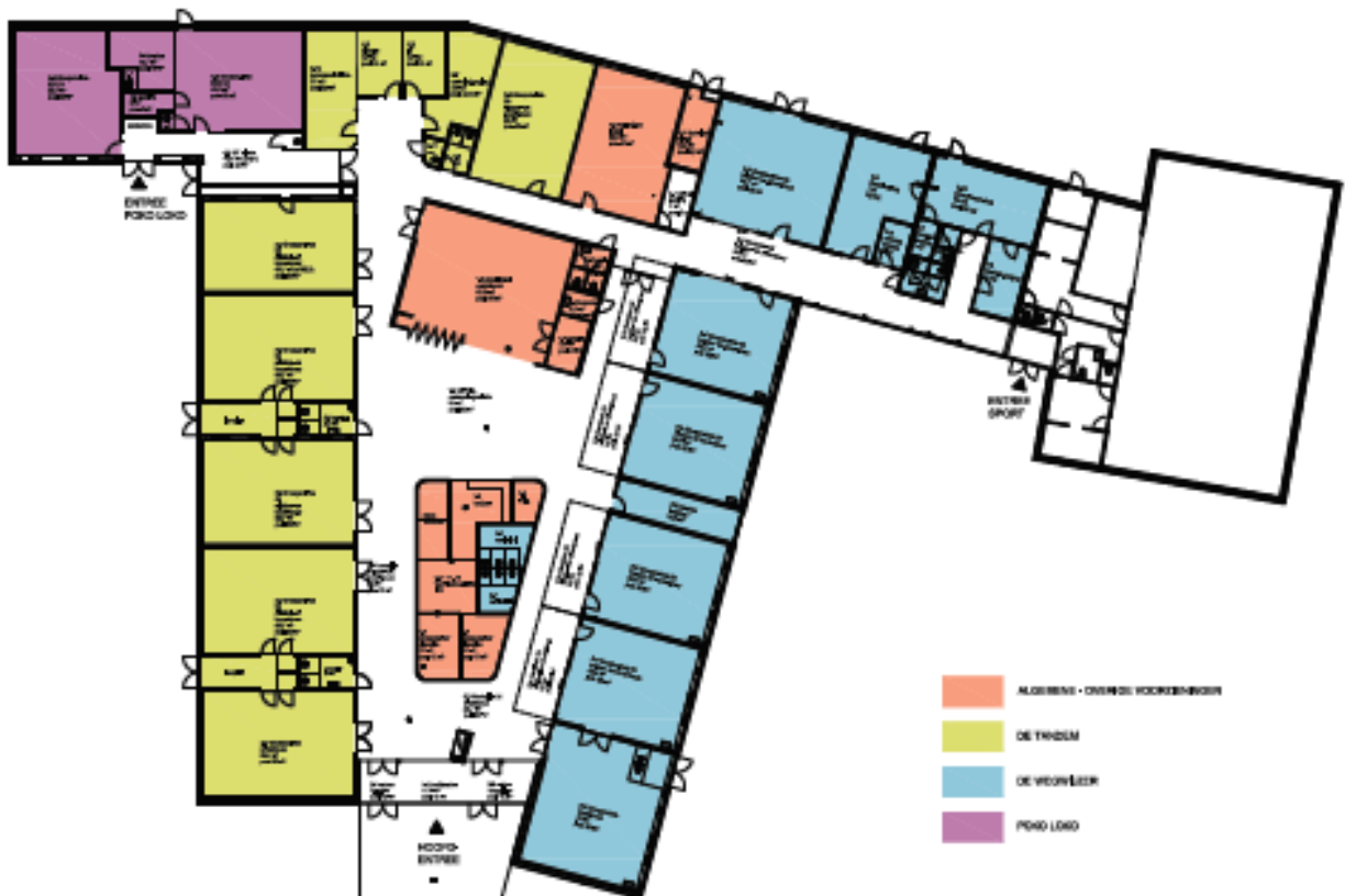
Figuur 2: plattegrond nieuwe situatie