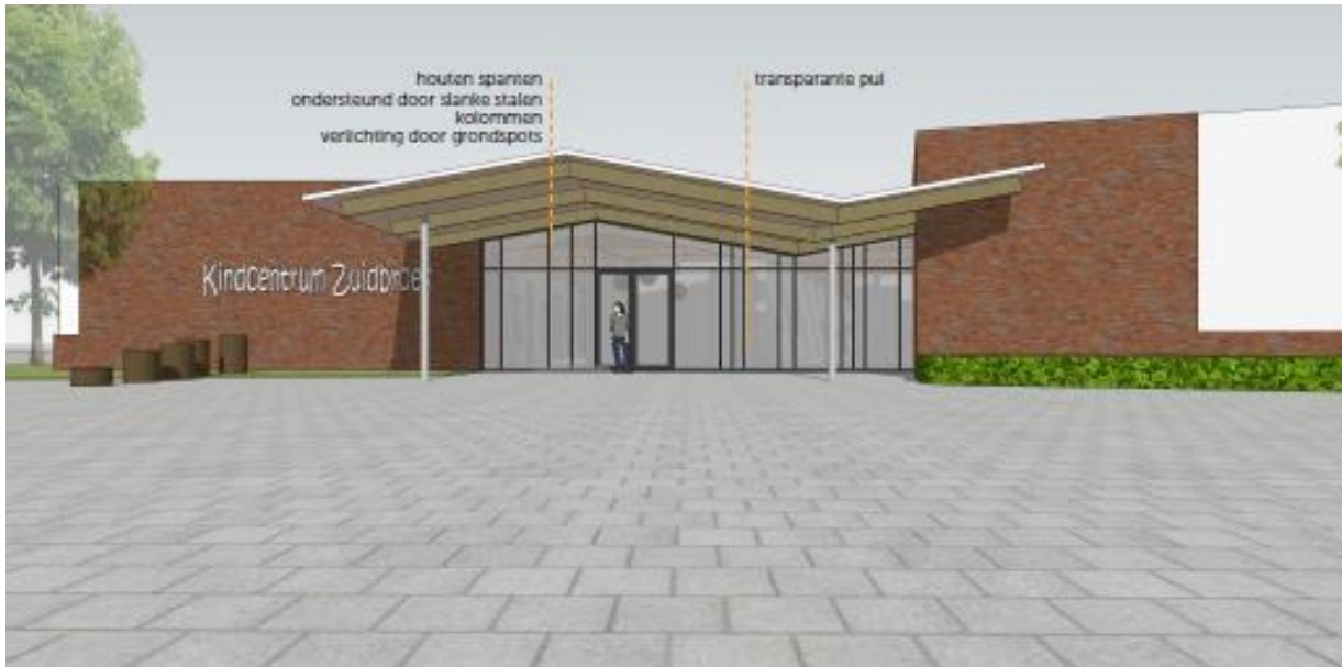
Figuur 3: Impressie nieuwe hoofdentree

In onderstaande impressie is te zien hoe de hoofdentree eruit gaat zien in de nieuwe situatie. De hoofdentree is op deze manier beter zichtbaar en geeft duidelijker weer waar je naar binnen moet voor de scholen en de kinderopvang.