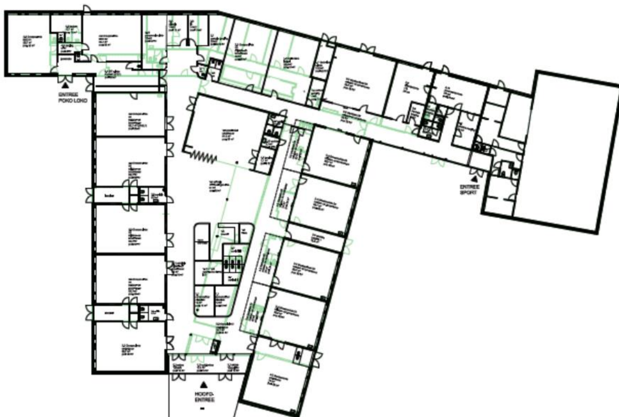
Figuur 4: Plattegrond bestaand en nieuw