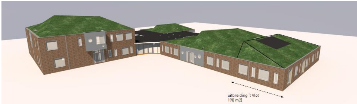
Figuur 3: 3D impressie uitbreiding 't Vlot