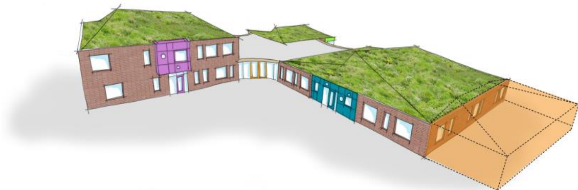
Figuur 2: 3D schets Kindcentrum Woldwijk 1