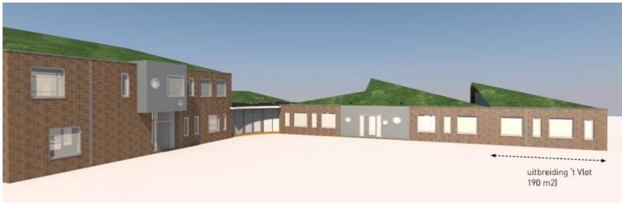
Figuur 4: 3D impressie uitbreiding 't Vlot