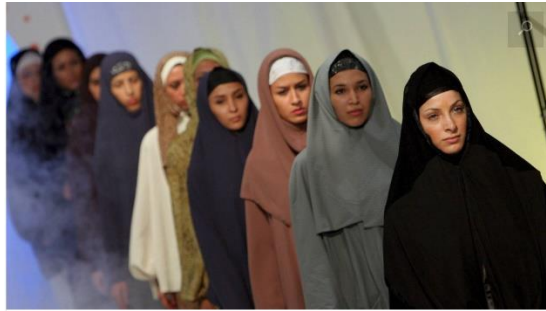
Fotomodellen die wél voldoen aan de wensen van de Iraanse overheid.