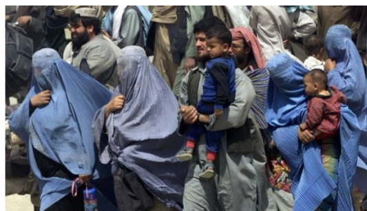
Women under the previous Taliban regime were forced to wear burkas and could not go out without a male relative