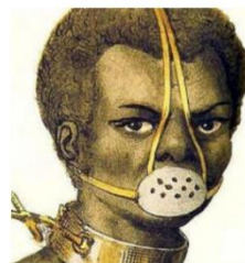
Mondkapjes gedragen vroeger door slaven